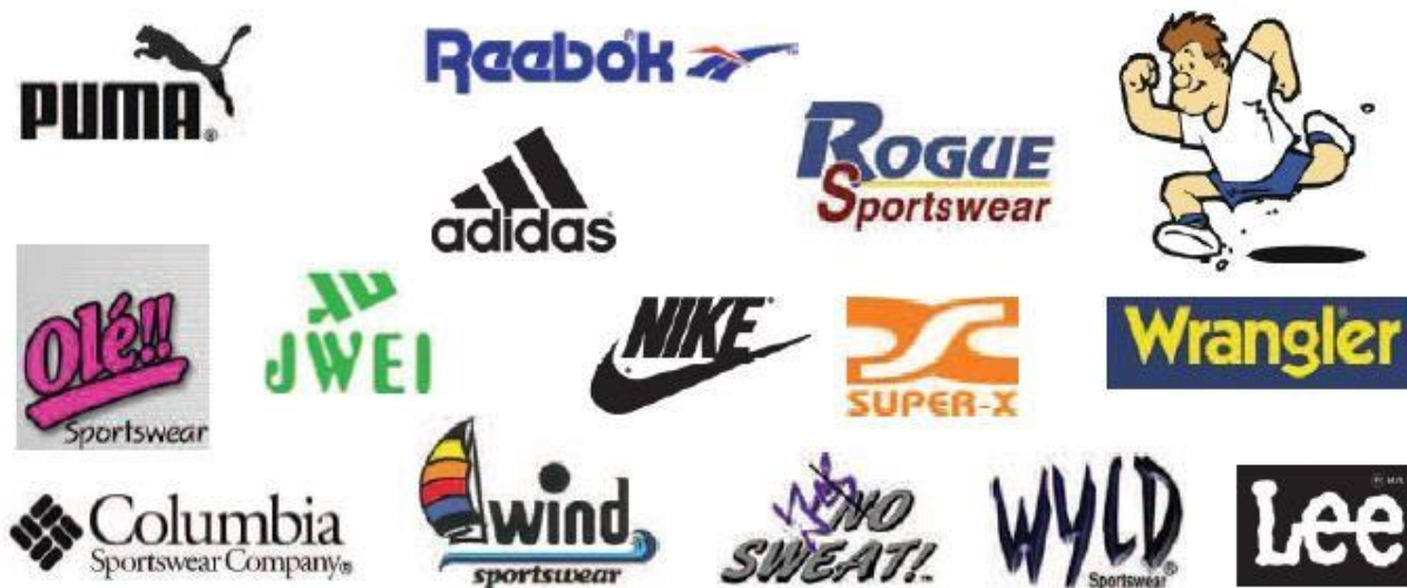
Рис.1- Види ТМ

Як позначення, яке може бути використане як ТМ, може бути будь-який образ, який людина здатна сприймати за допомогою будь-яких органів чуття. Існує цілий ряд обмежень, а точніше - встановлених законом підстав для відмови в реєстрації знака, про які йтиметься нижче, однак принципово щодо виду позначення, його природи або способу пред'явлення будь-яких обмежень не існує. Важливо, щоб це позначення людина могла сприймати і розрізняти серед інших, супроводжуваних товари, послуги.