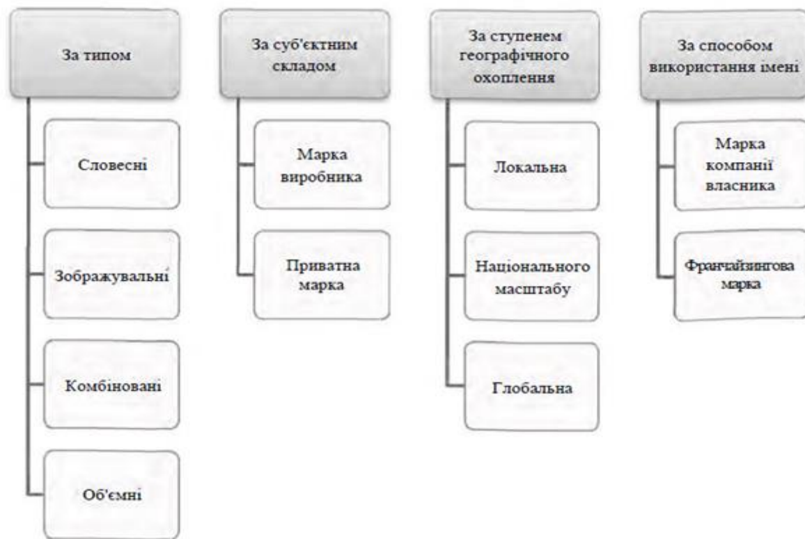
Рис. 2. - Класифікація торговельних марок

ТМ дає змогу відрізнити товари й послуги одних осіб від однорідних товарів і послуг інших осіб, а також часто замінює собою довге й складне найменування тієї чи іншої юридичної чи фізичної особи (див. рис.2).